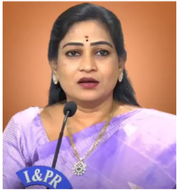
తీసుకొచ్చారు. వీక్షకుల రృష్టిని ఆకర్షించేందుకే జగన్ మాట్లాడుతారని తప్పు.. ఆయన దగ్గర ఏ ఆధారాలూ ఉండవని, ఆయన చెప్పేది వాస్తవం కాదని వెల్లడించారు.

మంగళగిరి: హెరిటేజ్ క్లీన్ చిట్ లో ఉన్న సంస్థ అని, ఆ సంస్థలో ఏదో జరిగిపోతోందని ప్రజలను జగన్ తప్పుదోవ పట్టిస్తున్నారని హోం మంత్రి అనిత అన్నారు. మంగళగిరిలో నిర్వహించిన మీడియా సమావేశంలో ఆమె మాట్లాడారు. చెప్పిన అబద్ధాన్ని పదే పదే మూడు గంటలపాటు చెప్పినందుకు జగన్ కు గిన్నిస్ రికార్డు ఇవ్వొచ్చని ఎద్దేవా చేశారు. హెరిటేజ్ సంస్థపై బురద చల్లడమే పనిగా కొండను తవ్వి ఎలుకను కూడా పట్టలేకపోయాడని అన్నారు. ఇందాపూర్ డెయిరీ నుంచి హెరిటేజ్ సంస్థ కొన్ని ఉత్పత్తులు కొనుగోలు చేస్తే తప్పేంటని ప్రశ్నించారు. హెరిటేజ్ ఇప్పటి వరకు ఏ సంస్థకు నెయ్యి సరఫరా చేయలేదని స్పష్టం చేశారు.