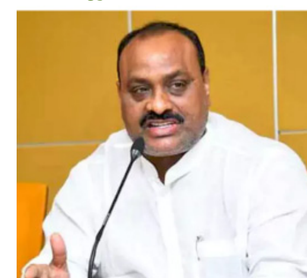
ఘటనలో ఆయన ప్రాణాలు నిలబెట్టింది వేంకటేశ్వర స్వామీనేనే సముక్తం చంద్రబాబుదని చెప్పారు. అలాంటి స్వామికి అవకీర్తి తెచ్చే పనిని ఆయన ఎప్పుడూ చేయరన్నారు. జగన్ మానస పుత్రిక అమూల్ కూడా ఇందాపూర్ నుంచి కొన్ని కొనుగోళ్లు చేసిందన్నారు. హెరిటేజ్ తో ఇందాపూర్ డైరెక్టర్లకు ఎక్కడైనా సంబంధం ఉందా అని మంత్రి కొల్లు రవీంద్ర ప్రశ్నించారు. అలాంటి ఆధారం ఒక్కదైనా వైకాపా చూపించగలదా అని సవాల్ విసిరారు.

అమరావతి: శాసన మండలిలో వైకాపా సభ్యులు క్షమాపణలు చెప్పాకే కల్లీ లడ్డా వ్యవహారంపై తాము చర్చిస్తామని మంత్రి అచ్చెన్నాయుడు తెలిపారు. ఆ పార్టీ ఎమ్మెల్యేలు క్షమాపణలు కోరి లెంపలేసుకుంటేనే వారికి తిరుమల పేరెత్తే అర్హత ఉంటుందన్నారు. అసెంబ్లీ లాబీలో మీడియాతో మంత్రులు అచ్చెన్నాయుడు, కొల్లు రవీంద్ర, అనగాని సత్యప్రసాద్, కొండపల్లి శ్రీనివాస్ ఇష్టాగోష్ఠిగా మాట్లాడారు.